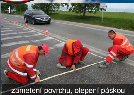
1 zametení povrchu, oлеpení páskou

drsňý dvousložkový plast s posypem pokládaný za studena ve dvou vrstvách