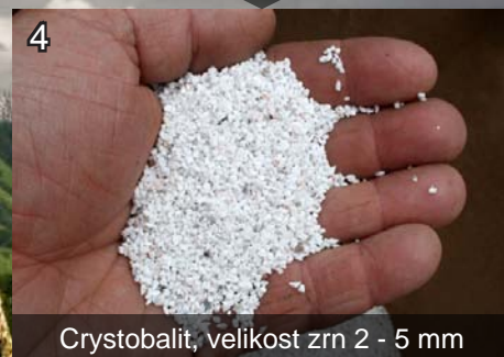
4 Crystobalit, velikost zrn 2 - 5 mm