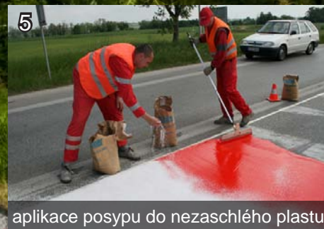
5 aplikace posypu do nezaschlého plastu