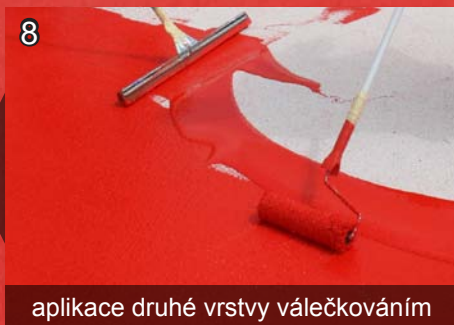
8 aplikace druhé vrstvy válečkováním