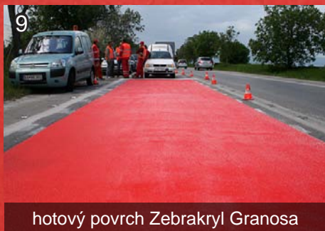
9 hotový povrch Zebrakryl Granosa