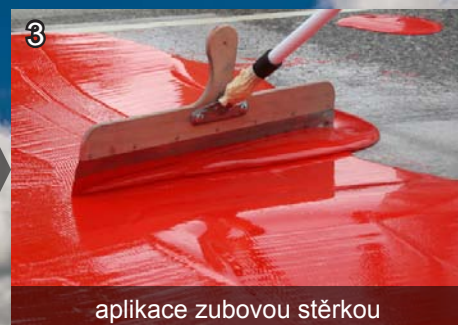
3 aplikace zubovou stěrkou