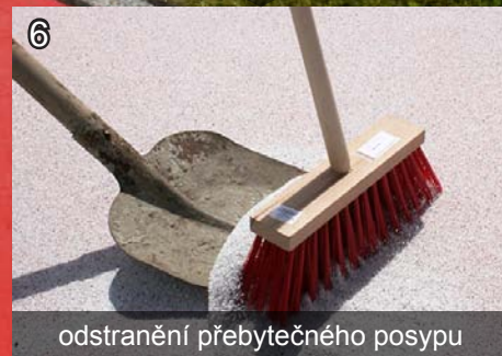
6 odstranění přebytečného posypu