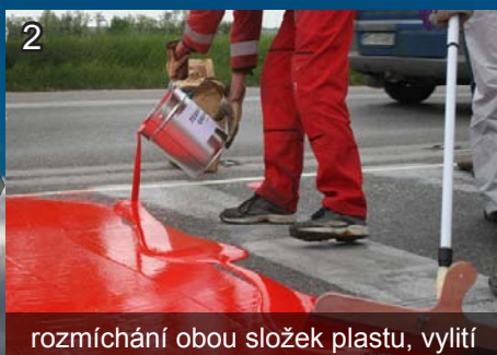
2 rozmíchání obou složek plastu, vylití